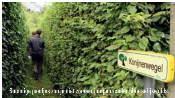
Sommige paadjes zou je niet zomaar inlopen zonder plaatselijke gids.

Dag van de Trage Weg wandelden. Of tik de naam van je gemeente in en kijk wat de mogelijkheden zijn. Voor mij zit de tragewegenwandeling in Laarne er na negen kilometer en twee uur stappen jammer genoeg op. Maar het kriebelt al om bij mij thuis ook eens op zoek te gaan naar die verborgen paadjes die stammen uit een tijd zonder auto's. Ik weet er alvast één liggen, nu de rest nog. <<